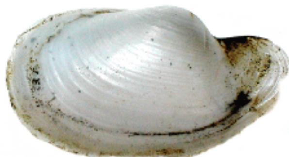
2003年4月16日佐賀漁港で採集されたオキナガイ。

右の写真は土佐湾の底曳き漁で採れるオキナガイ科のオキナガイ Laternula anatina です。やはり砂泥質に潜って生活しています。ソトオリガイよりはるかに薄い殻を持ち、ふくらみも強い貝です。